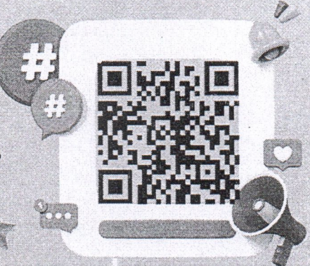
ลงทะเบียนเข้าร่วมประชุมฯ

โรงเรียน ครู และนักเรียน ที่เข้าร่วมจะได้รับ เกียรติบัตร