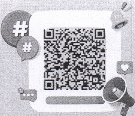
เอกสารโครงการฯ

โรงเรียน ครู และนักเรียน ที่เข้าร่วมจะได้รับ เกียรติบัตร